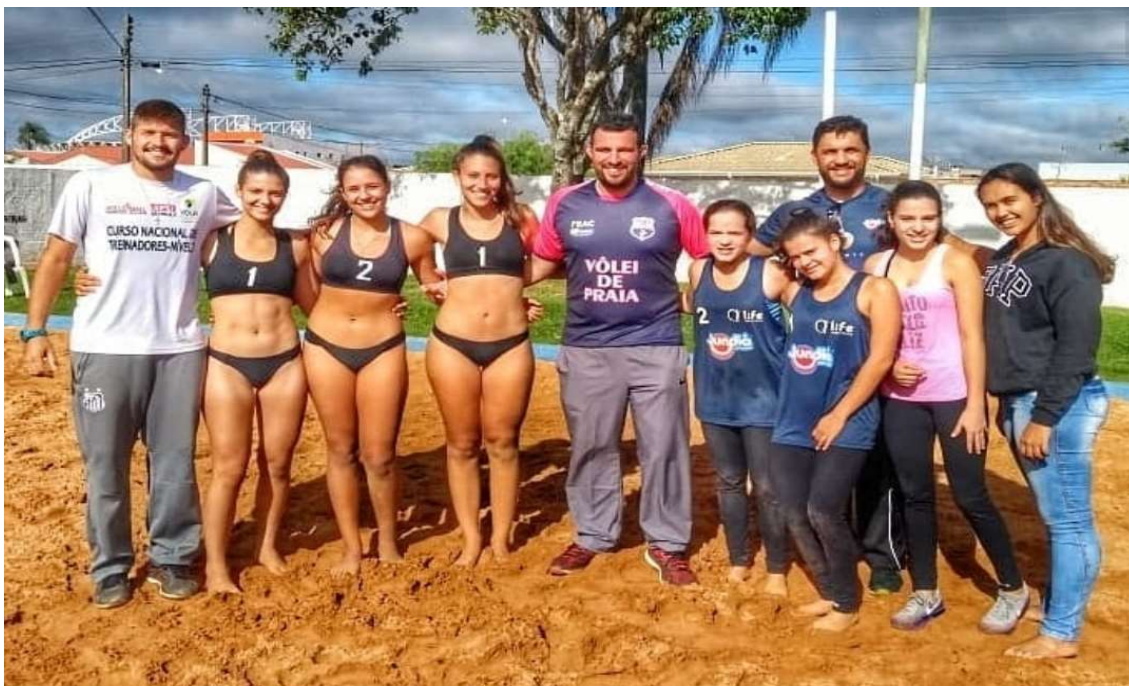
Anexo VI – Equipe de treinamento presente nos Jogos Regionais que foi realizado na cidade de Franca no mês de Julho.